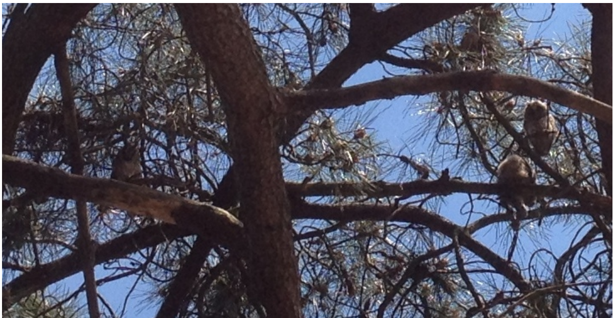
Volwassen uil met twee juveniele uilen.

Het enthousiasme van de mensen, waarbij Henk Peters apart vermeld moet worden. Henk heeft een aantal malen in zijn eentje gebied C en soms ook nog een gedeelte van gebied D doorkruist met de fiets. De nachtelijke uurtjes in de Duinen waren aan hem welbesteed.